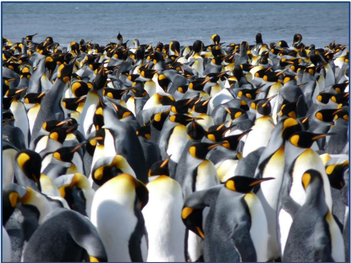
Colonie de manchots royaux, archipel Crozet