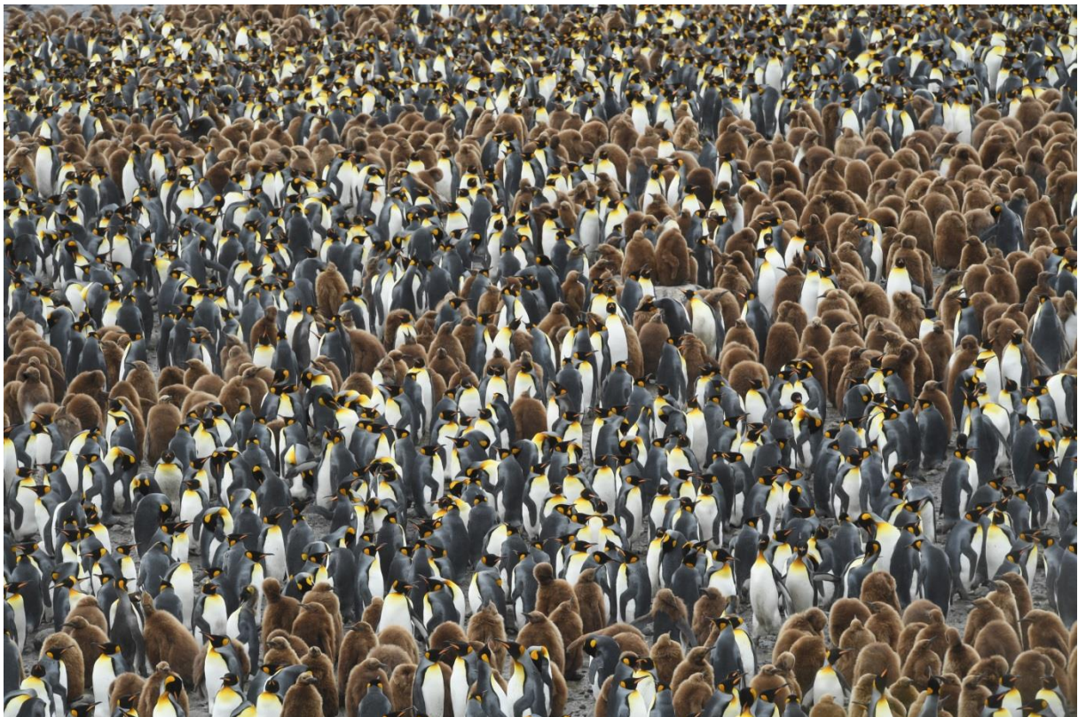
Colonie de manchots royaux, archipel Crozet

Du fait de leur éloignement des centres d’activités humaines, les Terres et mers australes françaises sont des vitrines de l’évolution biologique extrêmement préservées et constituent un territoire unique pour la recherche scientifique, notamment pour le suivi à long terme des populations d’oiseaux et de mammifères marins et pour l’étude des effets des changements globaux. Forte de ce patrimoine d’exception, la collectivité des TAAF, par le biais de la réserve naturelle et avec l’engagement de la communauté scientifique, a mis en place un système de gestion éprouvé et reconnu assurant son intégrité pour les générations futures.