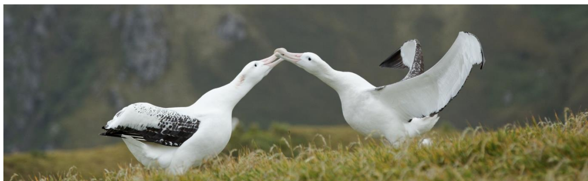
Parade de grands albatross, archipel Crozet