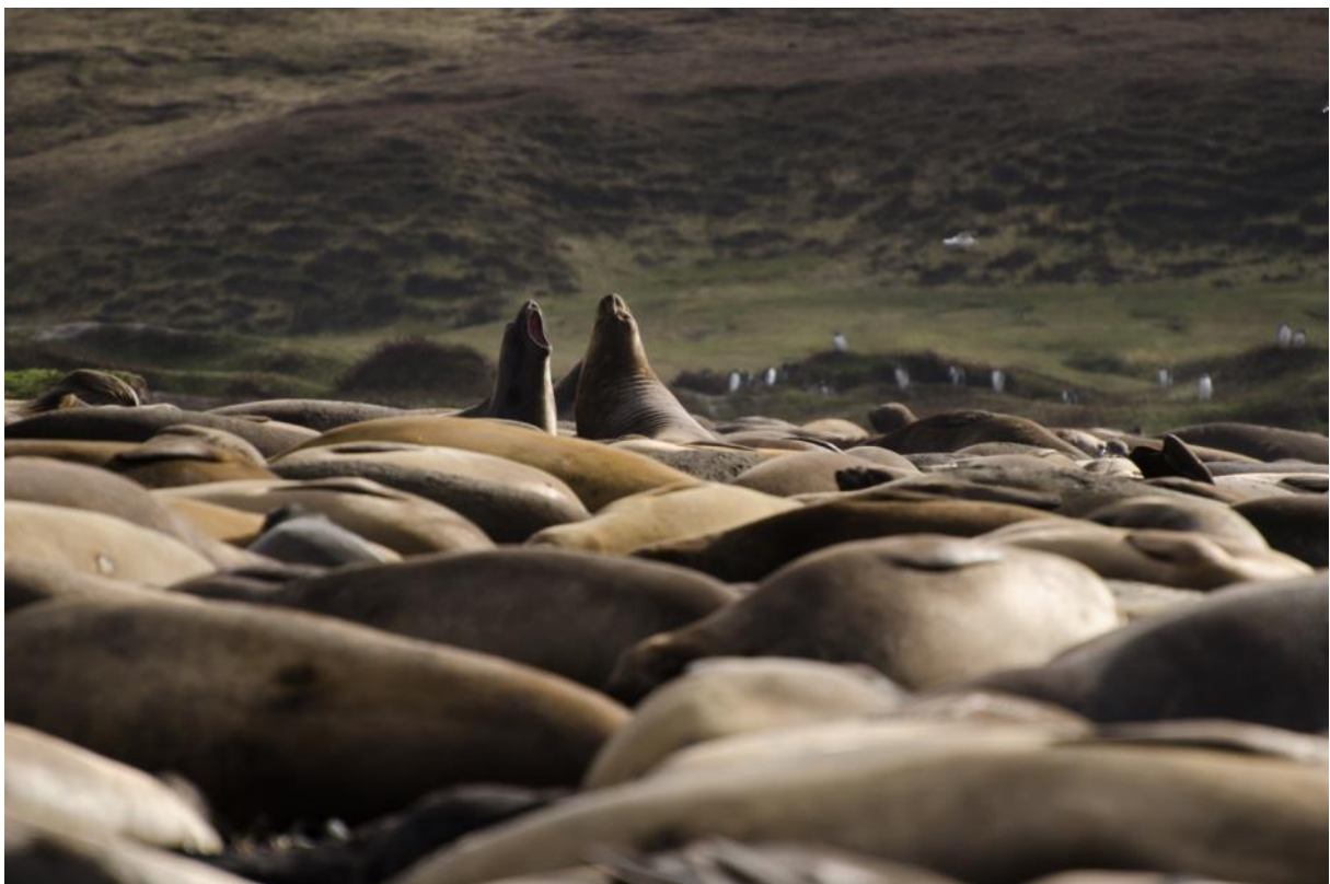
Groupe d'éléphants de mer, îles Kerguelen

Chargée de communication de la réserve naturelle nationale des Terres australes françaises