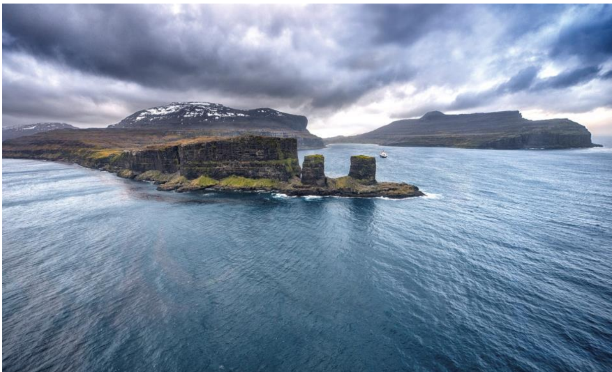
Arche des Kerguelen, îles Kerguelen