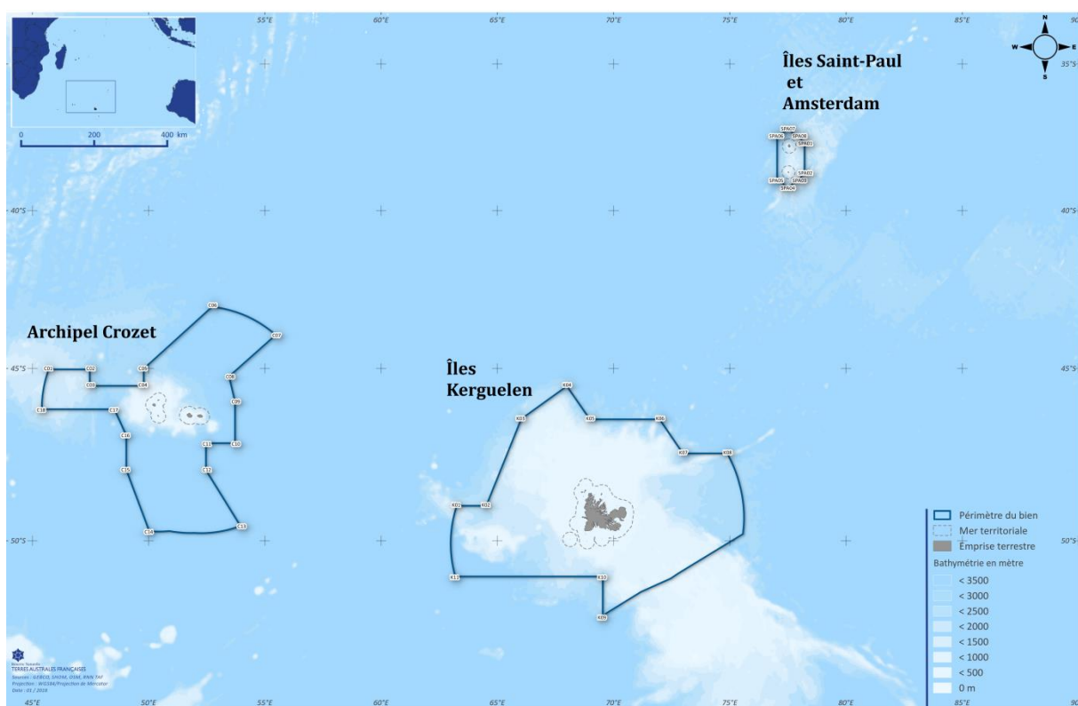
Carte du périmètre inscrit au patrimoine mondial

Avec près de 673 000 km 2 , les Terres et mers australes françaises sont l'une des plus vastes aires marines protégées (AMP) de la planète (6 ème AMP mondiale) et le plus grand bien inscrit sur la Liste du patrimoine mondial . Elles s'étendent sur l'un des plus grands gradients latitudinaux au monde, ce qui permet la pleine représentation de la biodiversité australe, au sein d'un ensemble qui présente des caractéristiques biologiques similaires (importantes concentrations d'oiseaux et mammifères marins notamment), une forte connectivité et des actions de gestion concertées à l'échelle du bien. Le modèle de gestion rigoureux développé par la collectivité des TAAF dans ces territoires, qui s'appuie sur l'existence d'une réserve naturelle nationale et d'un plan de gestion adapté pour les 10 prochaines années (2018-2027), est une garantie du maintien de l'intégrité du bien.